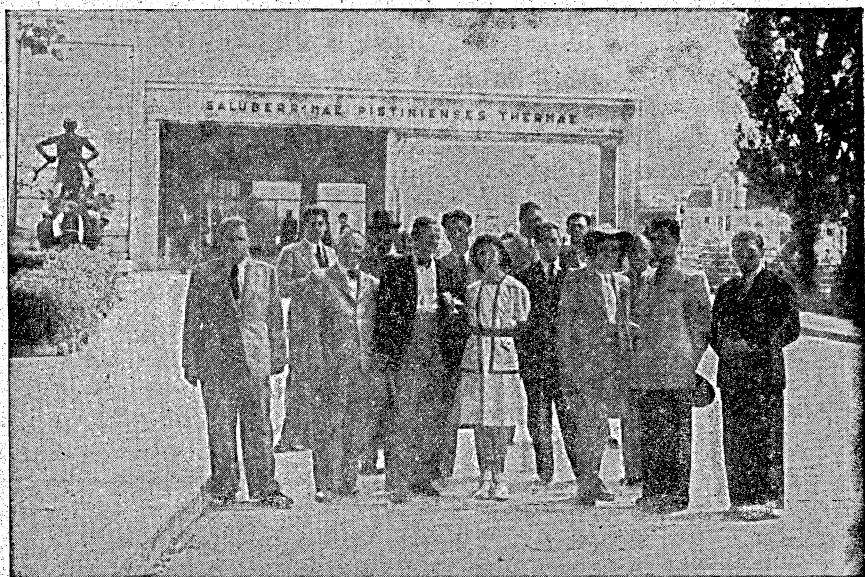
Výprava slovenských novinárov pri vchode na kolonádový most.