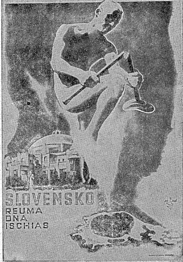
Symbolický znak piešťanských liečivých prameňov.