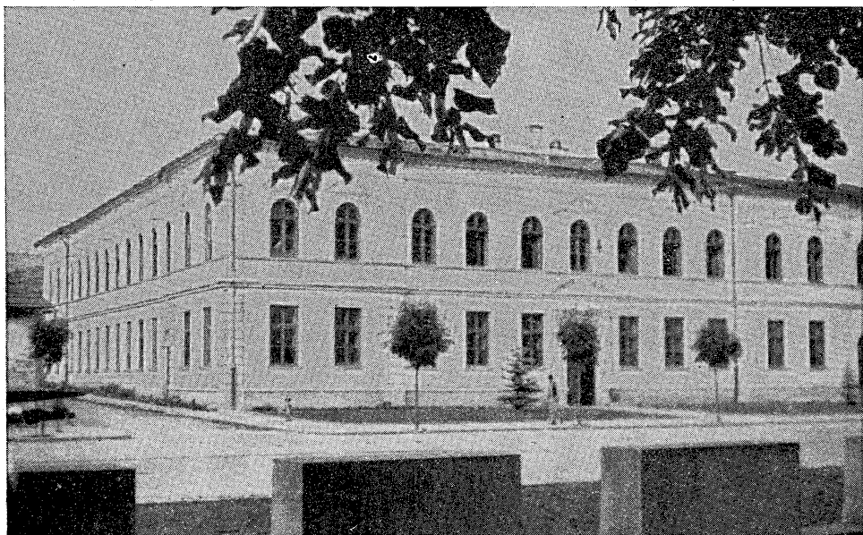
Budova Hviezdoslavovho gymnázia v Dolnom Kubíne.

Dňa 8. novembra 1921 zaviala po prvýkrát čierna zástava z budovy školy. Gymnázium oplakávalo nielen stratu veľkého syna slovenského národa básnika-génia, ale aj svojho veľkého priateľa a povzbudzovateľa. Býval vzácnym a milým hosťom školských slávností, s vrelou účasťou