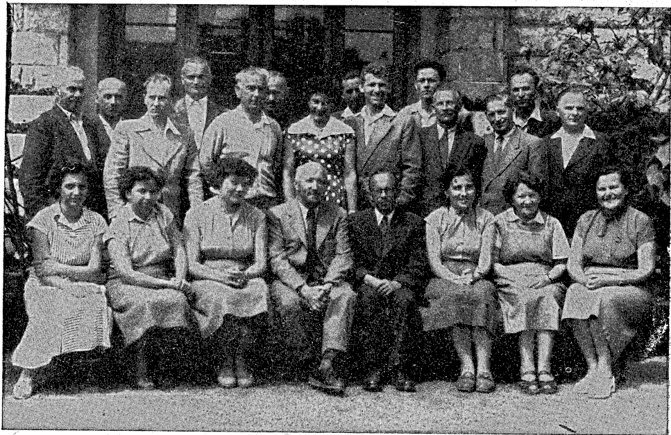
Učiteľský zbor Jedenásťročnej strednej školy P. O. Hviezdoslava v škol. roku 1958/59.

No veľmi skoro prišla ďalšia zmena v organizácii strednej školy. Podľa školského zákona z roku 1960 vznikli z predošlej dvanásťročnej školskej jednotky dve školy — základná deväťročná a trojročná stredná škola, ale zostali aj naďalej pod spoločným riadením do konca škol. roku 1966/67. Stredná škola bola pedagogicky usmerňovaná krajským národným výborom, deväťročná okresným národným výborom.