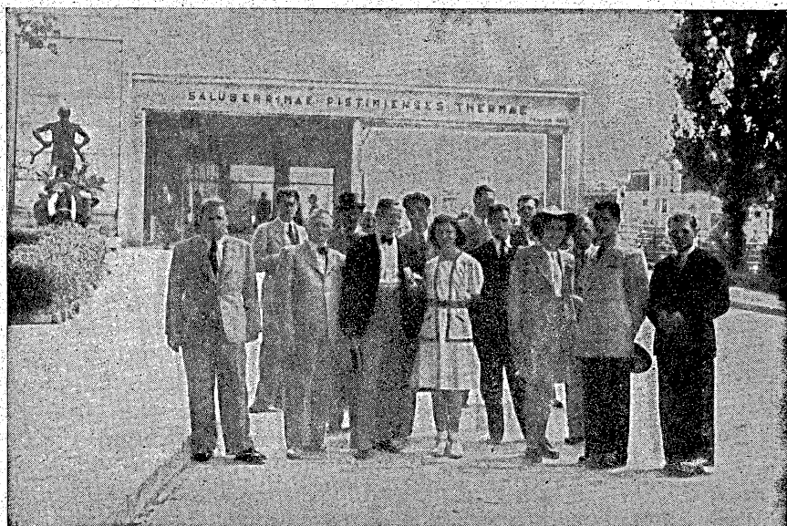
Výprava slovenských novinárov pri vchode na kolonádový most.