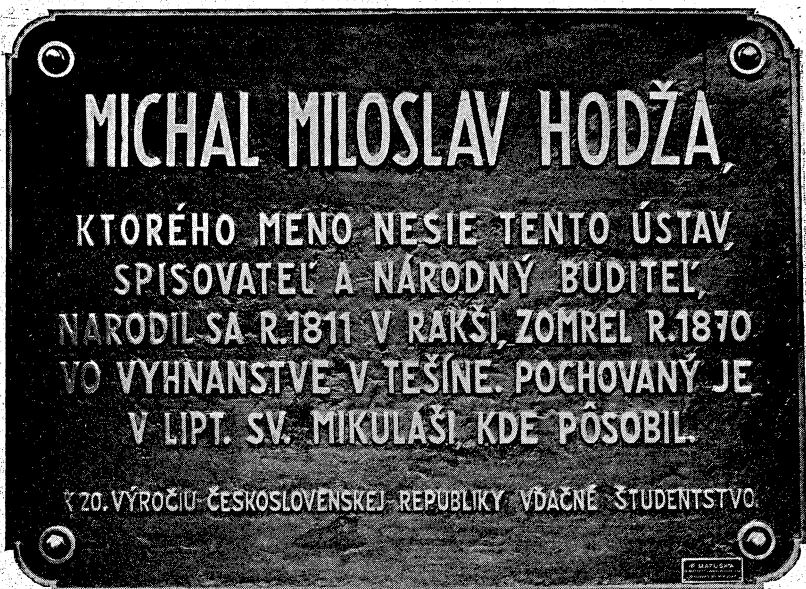
Pamätná doska M. M. Hodžu na budove št. čl. reál. gymnázia v Liptovskom Sv. Mikuláši.

A tak vstupuje naša škola do 20. výročia svojho trvania takmer s tisícom žiakov a žiačok, celou to legiou mladej slovenskej inteligencie, nádejou národa i štátu.