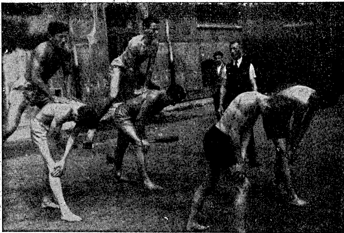
Živé náradie (preskoky roznožmo).

a pľúcnic 2, kýľa 2, chudokrvnosť 1, chron. gastritída 1, pľúcny katarh 2. Prvú pomoc poskytovali profesori telocviku. Žiaci a žiačky cvičili v predpísanom telocvičnom obleku. V hodinách telocviku precvičovali sa podľa min. nariadenia najzákladnejšie útvary vojenských cvičení porádových a pripomínal sa význam rekreácie a branosti v národe. Príležitostne konali sa pochodové cvičenia, exkurzie do kasární a vo voľnom terénu orientácia, čítanie máp, signalizovanie, odhadovanie vzdialenosti a pod.