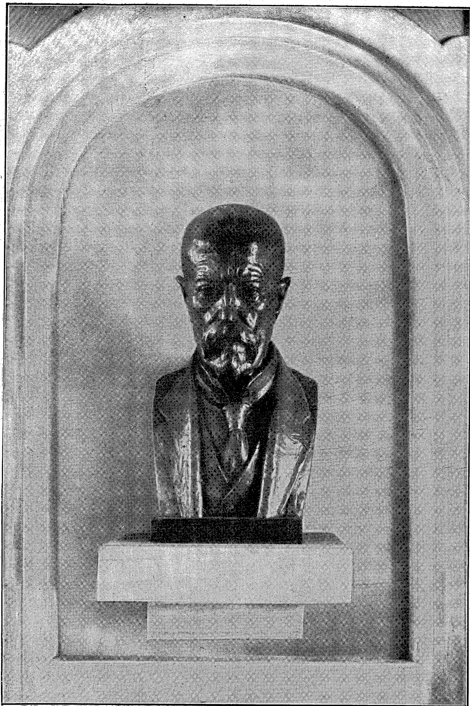
Busta prezidenta republiky T. G. Masaryka vo vestibule školskej budovy.