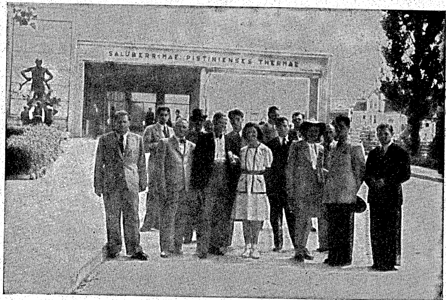
Výprava slovenských novinárov pri vchode na kolonádový most.