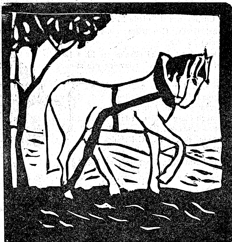
Do pola. Kreslil a do linolea vyzeral Ondrej Melicherčík.

Ústavu republiky Československej 1·40 Kčs.