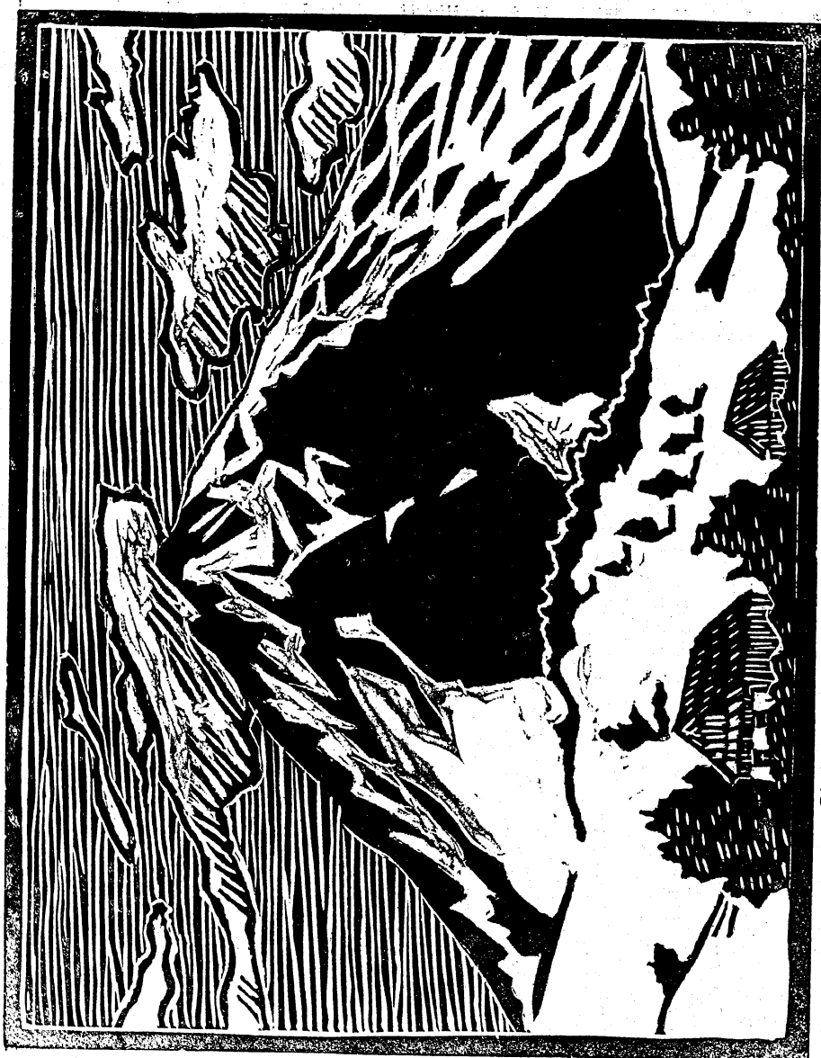
Choč. Kreslit a do linolea vryezal Milan Dudáš, IV. tr.