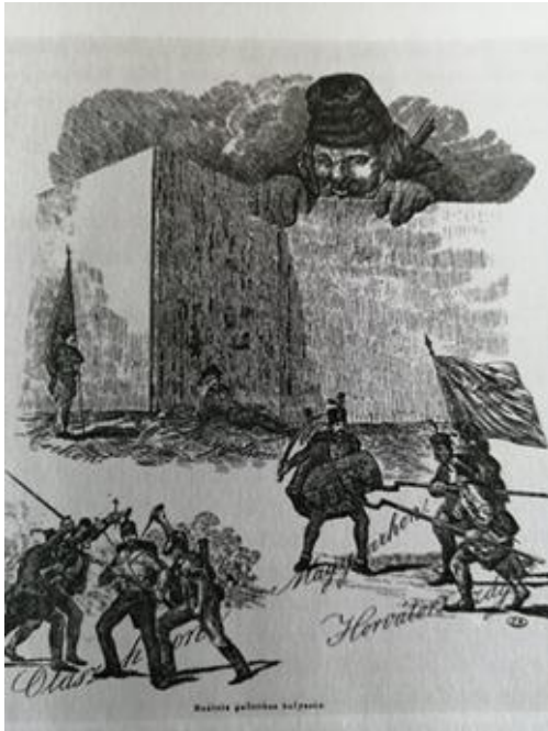
Karikatúra Politická situácia v Rakúsku 1848

A) Ako sa nazýva fórum, na ktorom sa zišli zástupcovia slovanských národov v júni 1848?